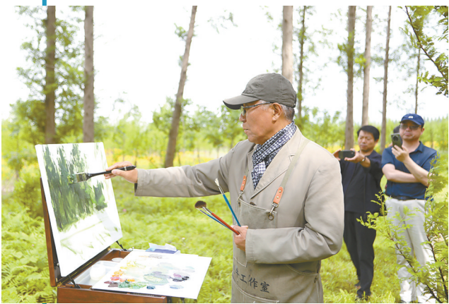
大美黄海森林公园