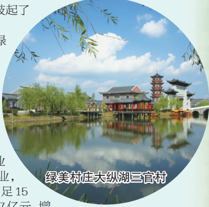
绿美村庄大纵湖三官村

近年来,我市不断擦亮“世界自然遗产”和“国际湿地城 市”两张国际名片,坚持林地、绿地、湿地“三地”同建,推动 林业与休闲、度假、康养深度融合,高品位实施森林氧吧、温 泉木屋、自驾游营地等项目,打造一批森林湿地生态旅游精 品线路。依托大洋湾、黄海森林公园、九龙口国家湿地公园 等生态空间,成功举办国际马拉松赛、中华龙舟赛等群众参 与度高、影响范围广的体育赛事,打造了盐城生态休闲旅游 的新亮点。