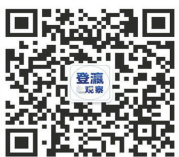
登报观察微信二维码