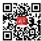
我言新闻客户端二维码