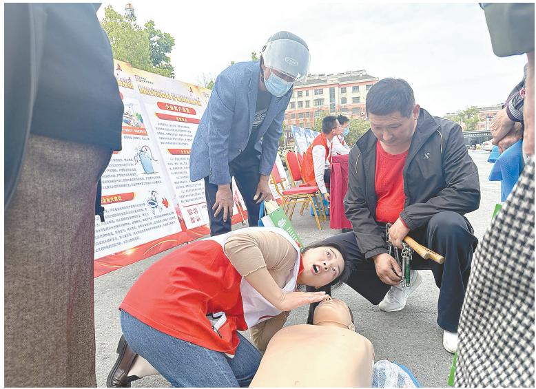
救护培训师向群众讲解急救知识。

“这个学了真的很有用。”“我能来操作一下吗?”“一听就懂,受益匪浅,谢谢你们。”……“这些朴实的称赞、真挚的认可,是活动现场一波又一波群众的真实反馈,也是激励我们继续前进的不竭动力。”滨海县红十字会负责人表示,下一步,他们将围绕急救知识培训“五进”和应急救援队伍“三进”要求,继续深入开展“应急救援百万培训”这一为民办实事工程,推动防灾减灾和急救知识的普及,增强群众急救知识水平和应对突发事件的能力,积极传播“人道、博爱、奉献”的红十字精神,全力守护人民群众生命健康。