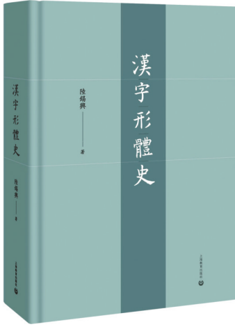
《汉字形体史》 陆锡兴著 上海教育出版社