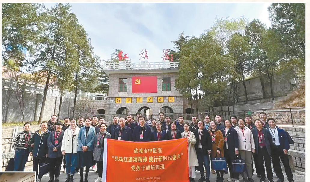
市中医院“弘扬红旗渠精神 践行新时代使命”党务干部培训班

通过学习,学员们感受到强烈的震撼和鼓舞,纷纷表示要从红旗渠精神中汲取营养,内化于心,外化于行,转化为每个人干事创业的实际行动,以勇担重任、敢为人先、团结协作、奋斗不息的高度主人翁精神,为市中医院高质量发展作出更大贡献。