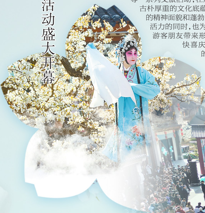
文/侍甜田 图/韩柏 刘朔池 姜澎