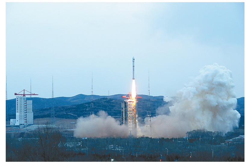
3月30日18时50分,我国在太原卫星发射中心使用长征二号丁运载火箭,成功将宏图一号01组卫星发射升空,卫星顺利进入预定轨道,发射任务获得圆满成功。