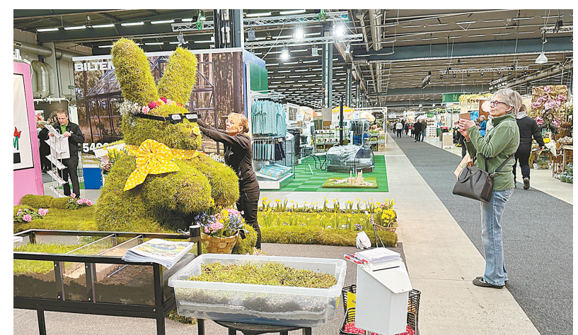
3月30日,人们在瑞典斯德哥尔摩参观北欧园艺展。2023年北欧园艺展于3月30日至4月2日在斯德哥尔摩举行。本次展会展出了各类北欧特色园艺产品,共吸引约300家展商参加。

据了解,通知自2023年4月1日起执行,以患者入院或就诊时间计算,此前发布的《关于实施“乙类乙管”后优化新型冠状病毒感染患者治疗费用医疗保障相关政策的通知》同步停止执行,相关政策视疫情发展形势再行调整。