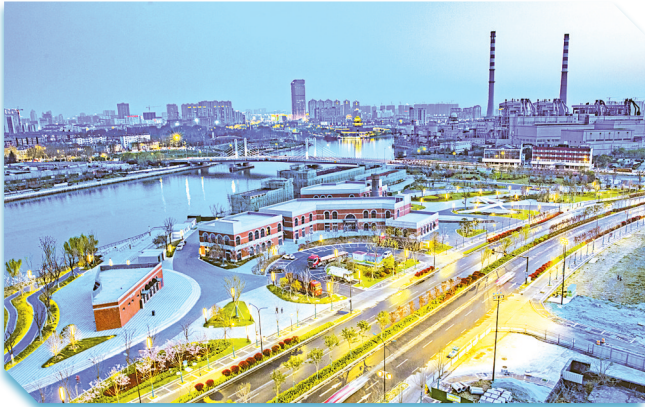
新洋港大道(盐青路)

3月22日,市交投集团与中远海运物流达成合作意向并现场签约。中远海运物流将与交投集团开展深度合作,共同建设海铁联运通道、水陆中转通道,在盐城市打造完善的物流供应链体系,为全市及周边企业提供“公铁水”立体物流解决方案和专业化供应链服务,促进全市商流、物流、资金流、信息流等多流合一,共同打造盐城地区央地合作的示范模板。