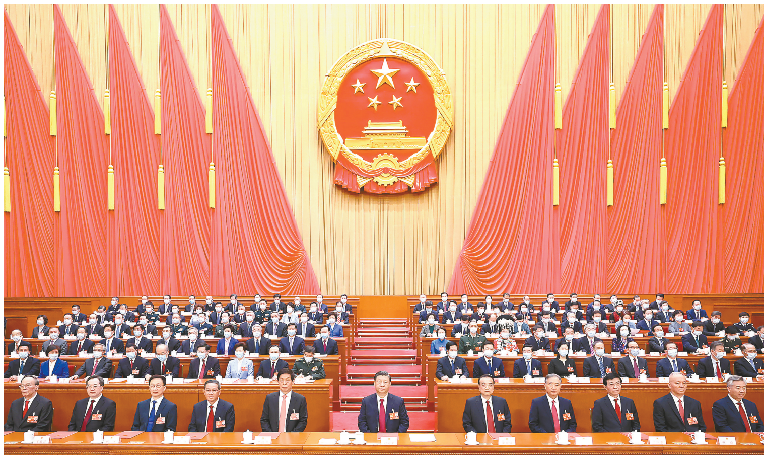
3月13日，第十四届全国人民代表大会第一次会议在北京人民大会堂闭幕。习近平等党和国家领导人在主席台就座。

新华社北京3月13日电 中华人民共和国第十四届全国人民代表大会第一次会议，在圆满完成各项议程，产生新一届国家机构组成人员后，13日上午在北京人民大会堂闭幕。