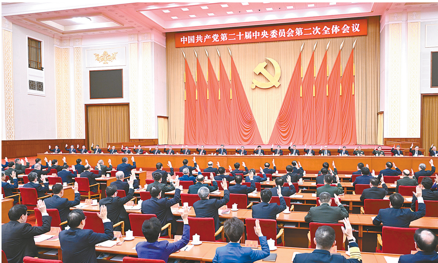
中国共产党第二十届中央委员会第二次全体会议，于2023年2月26日至28日在北京举行。中央政治局主持会议。