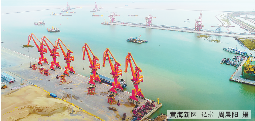
黄海新区 记者 周晨阳 摄