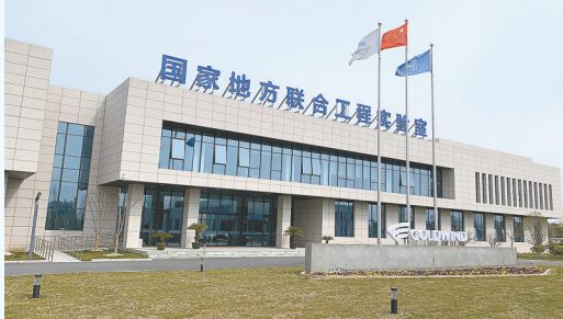
金风国家地方联合工程实验室