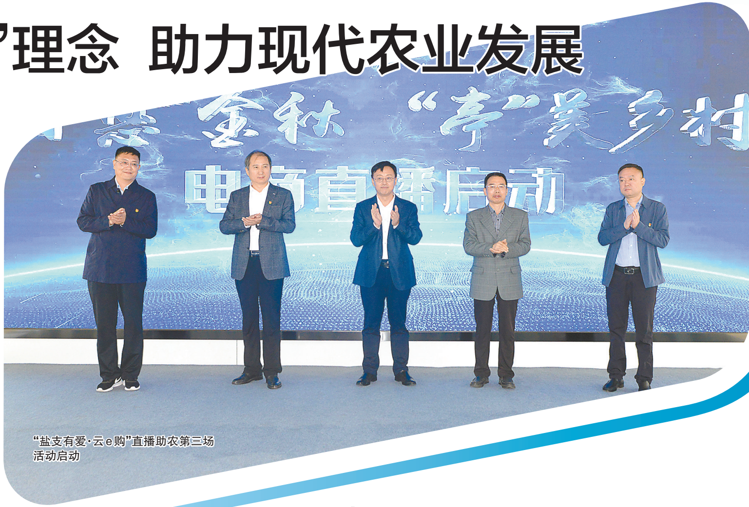
“盐支有爱·云e购”直播助农第三场活动启动