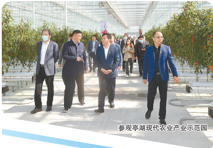
参观亭湖现代农业产业示范园