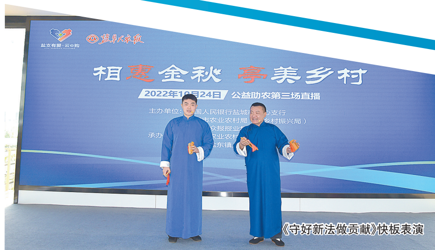
《守好新法做贡献》快板表演