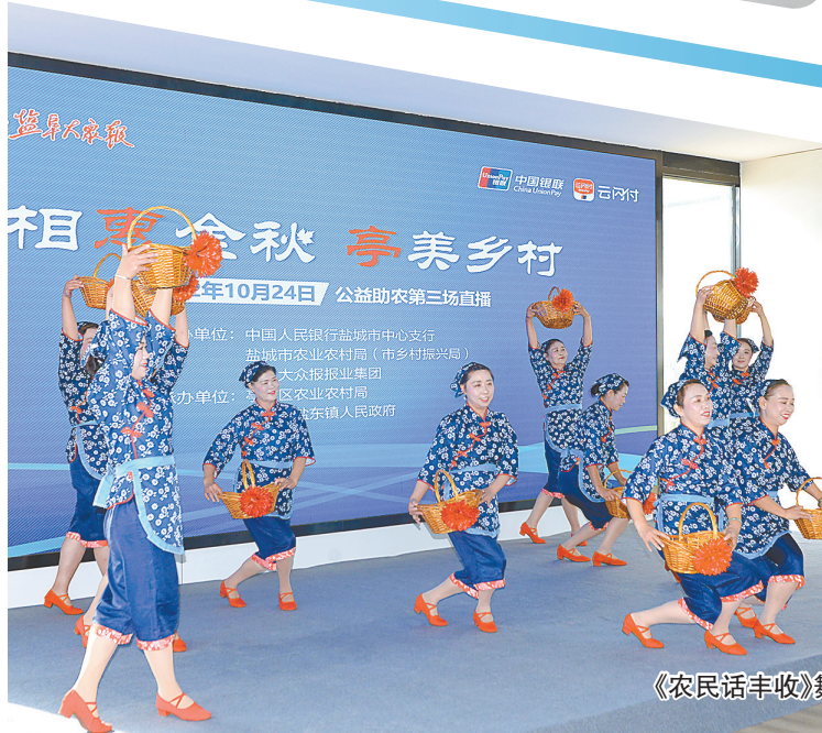
《农民话丰收》舞蹈表演