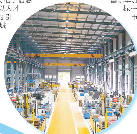
伟龙智能制造车间

高新区围绕半导体、新能源、新材料、高端装备、电子信息等先进制造业,以人才作支撑,贯标为引擎,充分发挥盐城东台两级市长质量奖优秀企业示范效应,导入两化融合贯标体系、知识产权管理体系、安全管理体系、能源管理体