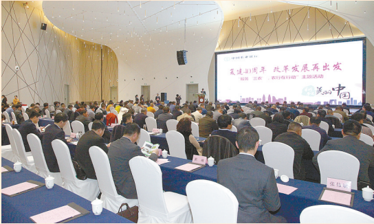
举办“复建40周年 服务‘三农’ 农行在行动”主题活动

粮安天下，农稳社稷。 农行服务向农而生。党的十八大以来，农行盐城分行心系“国之大者”，把服务“三农”作为置顶项、首选题，出台《乡村振兴金融服务行动方案》，聚焦农产品稳产保供、农业产业化龙头企业、种业振兴、美丽乡村建设和数字乡村等5个重点领域，创建金融服务5大模板，推出“兴业、富民、强村、数字”4大项25类金融产品，着力打造乡村振兴金融服务5大“主力军”。并配套出台县域旅游等3个重点领域行动方案、支持新型城镇化等10个重点业务服务方案，成功构建富有盐城特色的“1+3+10”乡村振兴金融服务体系。 通过战略联盟方式，加深加密与粮食、农业农村主管部门的战略合作，重点支持了132户粮食收购经纪人大户、4家粮食购销企业、2850户种植面积100亩以上的种植大户；通过整村推进方式，围绕“一镇一特”“一村一品”，建立全市各镇村特色经济和经济能人信息档案，实行集中批量获客，提供全方位的金融服务。截至今年9月末，已全面推进1464个行政村的整体服务，累计完成1.75万农户白名单的收集，授信60.96亿元；通过“三农”高级顾问方式，聘请1226名威望高、信用好的村干部、经济能人担任服务“三农”高级顾问，覆盖行政村(含涉农居委会)1032个，打通了金融服务进农家的“最后一公里”。 与此同时，该行准确研判和精准把握新时期“三农”工作新特点、新要求，应势而为、因时而动，以“三农”和县域业务发展阶段性规划导航开路，全力打造县域领军银行，携领辖内7家县域支行根据自身资源禀赋特点，制定实施“一县一方案”和“一行一策”实践路径，同时明确“三个55%”的资源倾斜政策，即该行55%的信贷计划用于县域、55%的财务资源用于县域、55%的新招聘大学生安排在县域，全面提升服务乡村振兴的能力水平。 强化数字赋能乡村振兴，创建线上融资、移动支付、电商金融三大平台，积极打造基于移动互联网的新场景，推广农户线上融资、涉农产业链“数据网贷”等新模式，着力提高“三农”金融服务的效率和可获得性。积极推广农村集体资产监管系统，推进农村集体“三资”管理数字化转型向更高层次迈进。 非凡10年，高歌飞扬。该行县域贷款余额554.3亿元，比2012年增长了4倍；全行涉农贷款余额达471亿元。