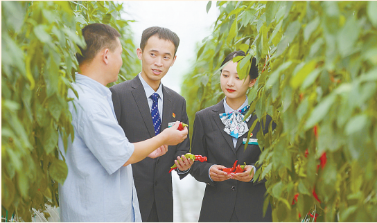
支持农业特色产业发展