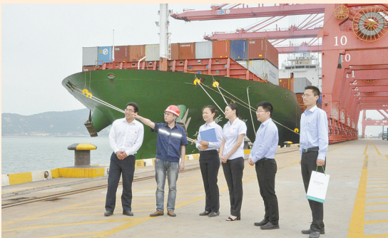
支持重大项目建设