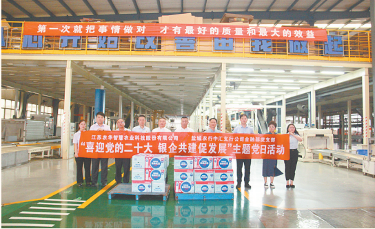
与企业开展党建共建活动