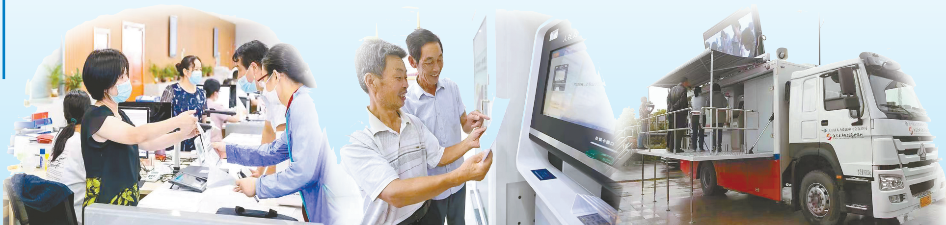
盐城市人社综合快办服务高效便捷、称心更暖心。