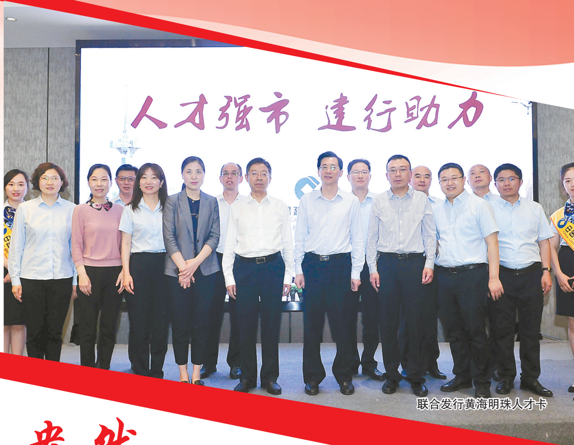
联合发行黄海明珠人才卡