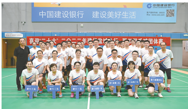
举办全行员工运动会