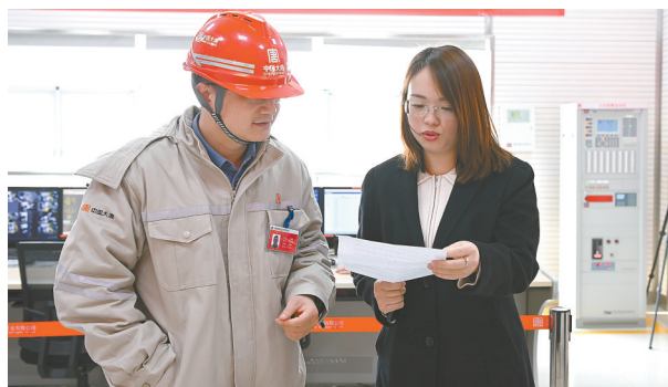
开展普惠金融上门服务