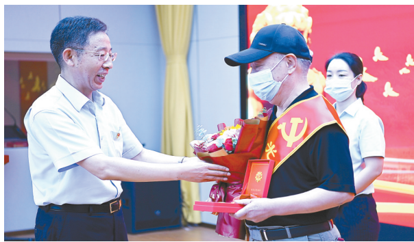
举办“两优一先”颁奖活动

该行牢牢把握绿色金融发展机遇。加大清洁能源、清洁能源、生态保护等传统产业信贷投放,积极拓展节能减排、低碳技术等新兴领域。加大工业领域绿色储备力度,支持石化、钢铁、造纸等传统行业优质企业绿色低碳发展、搬迁入园和转型升级;支持光伏产业、风电设备、环保产业等绿色工业,积极打造绿色产业链品牌。当年为光伏产业投放贷款2.5亿元,风电等清洁能源项目投放贷款7.98亿元。