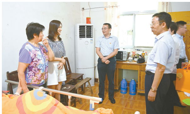
开展慰问贫困农户活动