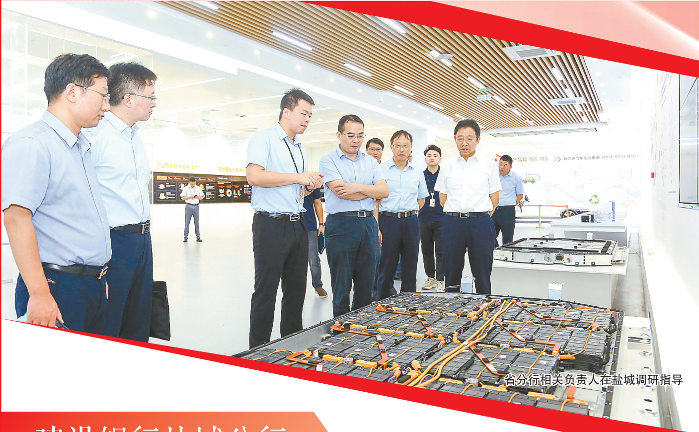
省分行相关负责人在盐城调研指导