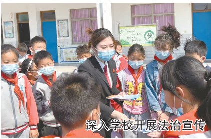
深入学校开展法治宣传

我市全面对接诉与非诉网上服务平台,持续打造“苏解纷”非诉服务平台,实现线上线下“双通道接入、一体化运行”的服务机制。目前,我市“苏解纷”非诉网络平台PC端入驻机构645家,入驻人员1171人,“苏解纷”微信小程序社会用户注册数近19万个,基本实现了非诉案源网上全流程办理,方便群众在线查询、预约、办理非诉讼纠纷化解事项。