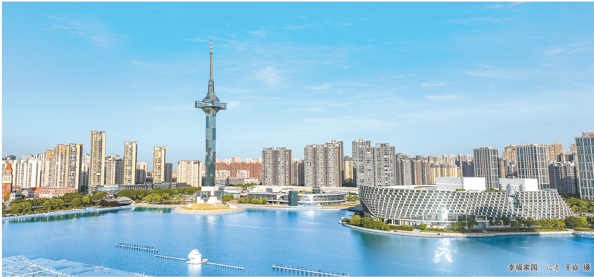
幸福家园