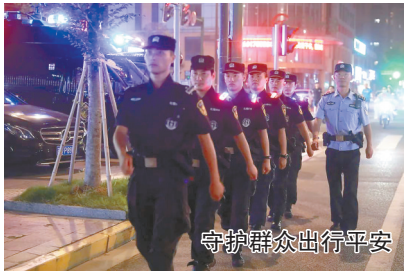
守护群众出行平安

在市委、市政府坚强领导下,我市坚持“实干、实绩、实效”导向,以非常之担当防风险、护稳定、促发展,用非常之举措夯基础、抓打防、提实力,较好完成了各项任务,确保了全市社会大局持续平安稳定。