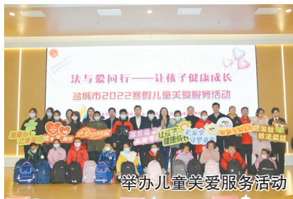
举办儿童关爱服务活动

全力维护特殊群体权益也是基层民主自治的一项重要工作。近年来,我市持续加强留守儿童关爱保护,全面提升“家庭、学校、社会、网络、政府、司法”六位一体的未成年人保护体系建设力度。2022年我市新建扩建10个省级示范性未成年人保护工作站(关爱之家),项目计划总投资313万元,截至7月底完成投资318.6万元,占计划投资额的101.81%。目前全市125个镇(街道)及2396个村(居)全部配备了儿童督导员和儿童主任,对留守儿童定期上门走访,确保儿童监护责任落实到位、“1+1+1”结对关爱保护到位。