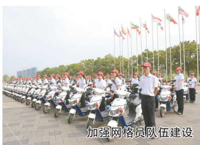
加强网格员队伍建设

——夯实基层基础,持续提升基层治理能力水平。我市在强化基层综治力量的同时持续推进“四专标准”网格员配备。在全市12062个城乡综合网格已全覆盖配备12343名专职网格员的基础上,配备城乡社区专职网格员达3221名,将专职网格员纳入社区工作人员管理体系,有效提升网格队伍综合素质和履职能力。在推进“精网微格”工程实施过程中,我市充分发挥微网格联络员与志愿者协助专职网格员担任社区平安稳定工作“政策法规宣传员、社情民意收集员、社会稳定促进员”“三大员”作用。