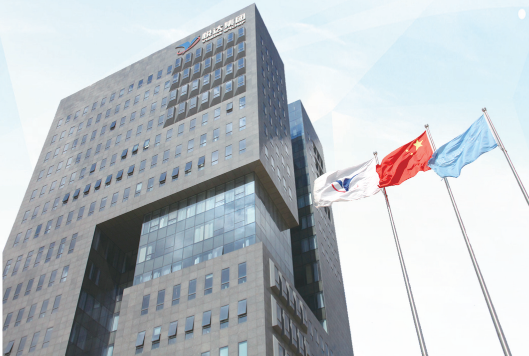
悦达集团总部大楼