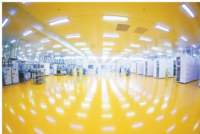
润阳悦达光伏高效太阳能电池生产线

推动新能源汽车全面崛起,实现悦达汽车产业新突破。悦达起亚进入新合营时代。华人运通高合HiPhi X持续领跑50万元以上豪华纯电汽车市场,累计销量超7000辆,第二款量产车型HiPhi Z开启预订。江苏国新新能源乘用车有限公司与行业头部企业实现战略合作。与凌云工业股份有限公司合资组建新能源科技公司,总投资20亿元的新能源电池壳项目落地盐城经济技术开发区。由悦达投资领投、高瓴资本及凯石资本等知名机构跟投的磷酸锰铁锂正极材料项目落户盐城新能源汽车产业园。抢抓省、市“智改数转”政策机遇,着力锻造专精特新“小巨人”企业,全力建设一批数字化车间、智能化工厂,抢占发展制高点。悦达纺织加快推动10万锭智能化改造项目,配套建设光伏、储能设施,打造绿色智能标杆工厂。智能农装、专用车、威马悦达等制造业企业加快数字化转型,不断提升生产效率,降低能源消耗量,提升核心竞争力。聚焦新材料、智能装备、智能网联等战略新兴领域,以项目建设夯实发展根基。中科悦达石墨烯导热膜项目成功引进上海复星高科技(集团)有限公司等外部投资者参与首轮融资,产业化项目加速落地盐城,长三角(盐城)智能网联汽车试验场项目全面开工建设。