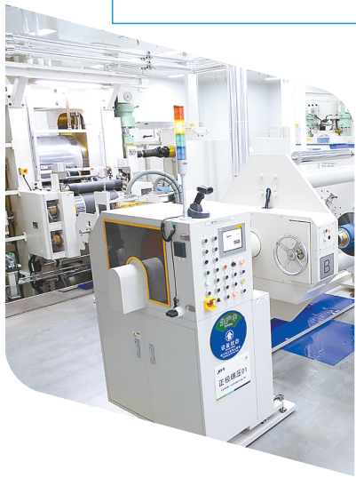
天津捷威动力电池公司生产车间

深入贯彻落实全市“大走访大推进大招商”活动相关要求,在悦达集团系统内扎实开展“职工大走访、项目大推进、营销大突破”活动,集团领导班子带头,深入基层,走进一线,与企业管理者座谈,与职工群众交心。活动开展以来,共走访企业27户,调研覆盖职工近1.4万人,全面掌握企业困难和职工诉求,全力协调推进项目建设进度,着力防范化解潜在堵点痛点,探索完善挂钩联系常态机制,以确定性工作克服各类不确定性因素影响,凝心聚力,克难奋进,为完成全年工作目标奠定坚实基础。深入推进国企改革三年行动。坚持向改革要活力要动力,在健全市场化经营机制、提升企业经营质效方面按下“加速键”。今年以来,共修订完善各类制度规范50余项,有效提升依法合规治企能力;累计清退非主