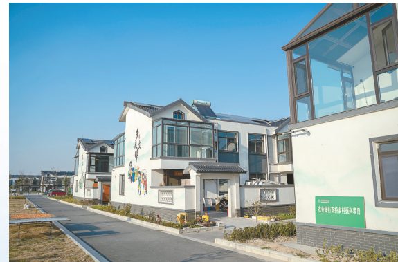
农行支持农房改善项目