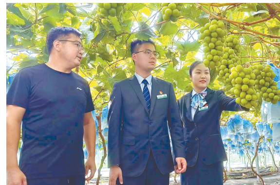
深入种植园送金融服务

数据显示,截至7月末,该行县域存款“四行一社”增量份额分别为26.85%、23.32%,全部达标。重点领域投放实现“四高于”:涉农贷款、乡村振兴产业贷款、乡村建设贷款、粮食安全领域贷款增速均高于县域贷款增速。