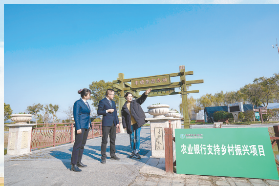
农行助力乡村农场建设

江苏省现代农业产业技术体系 江苏(大丰)现代农业(蔬菜)科技示范园 繁殖火焰南天竹新品种 火焰南天竹作为近年来国内园林绿化的新宠,市场需求大。而作为由国外引进的火焰南天竹新品种,种源、成本等因素制约其市场推广。基地从美国引进的火焰南天竹新品种,并加以选育,进行组织培养扩繁,初步解决上述难题,有利于进一步扩大市场份额。