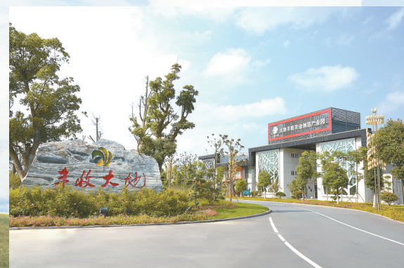
农行支持丰收大地产业园发展