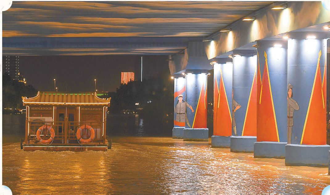
东进桥下融入新四军元素