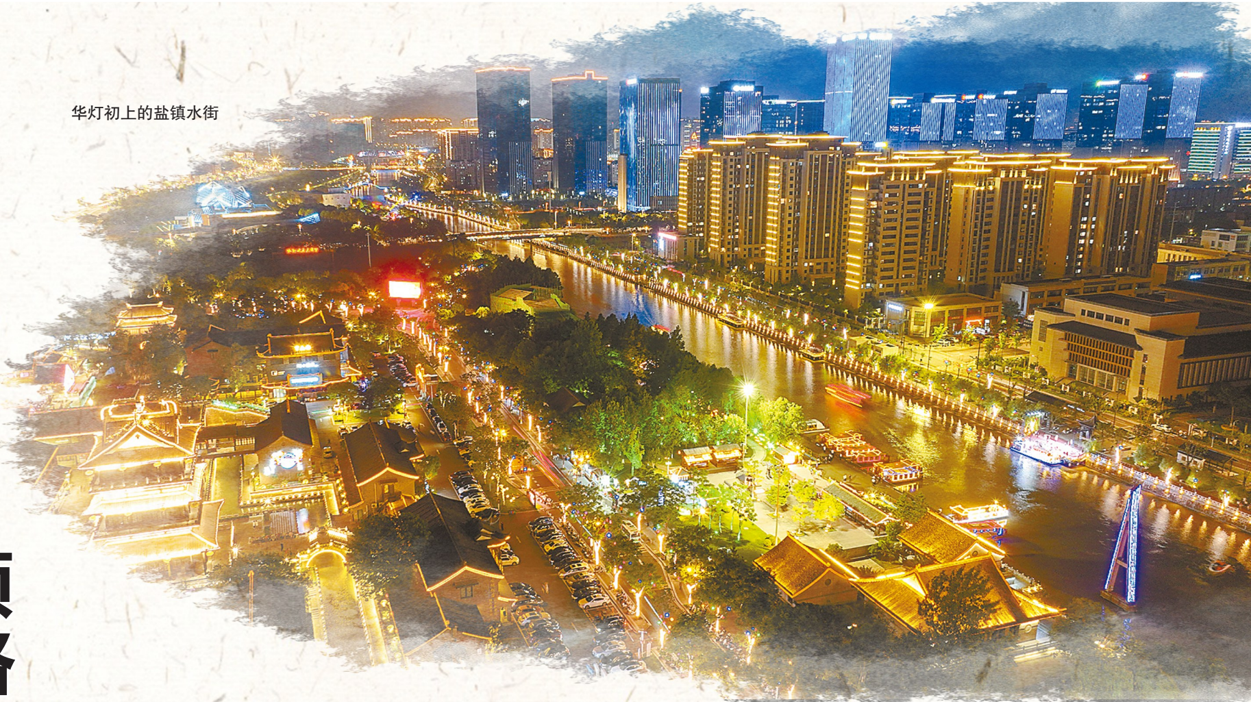
华灯初上的盐镇水街