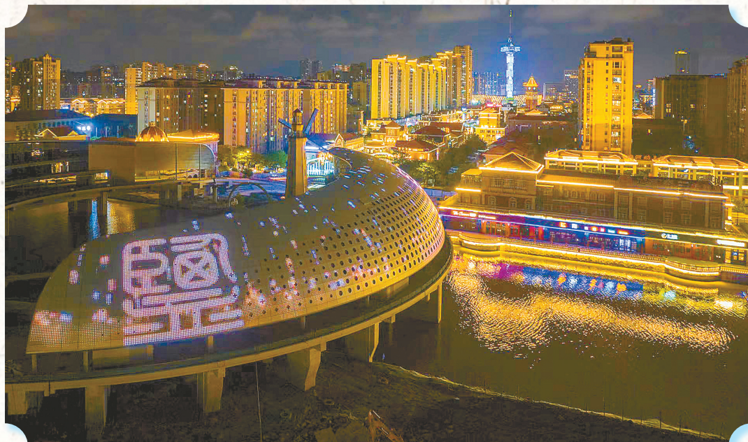
欧风花街码头景点