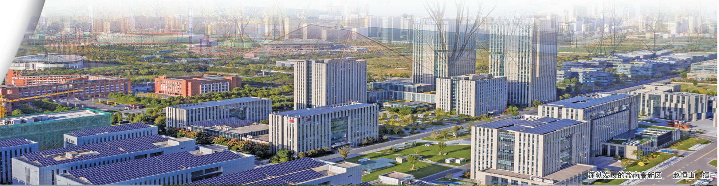
蓬勃发展的盐南高新区