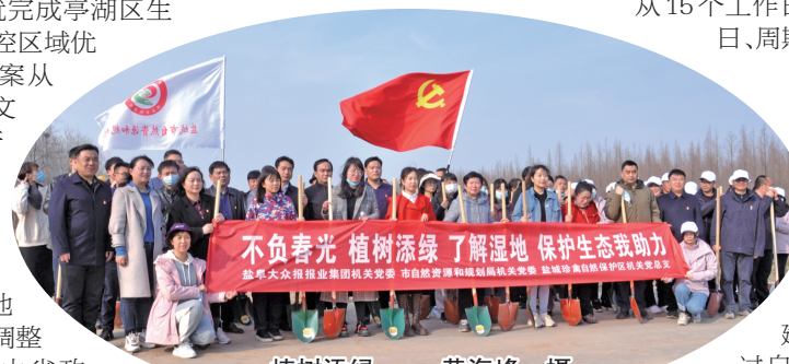
植树添绿

成功获得343国道大丰至盐都段工程、204国道阜宁花园至亭湖新兴段工程项目用地批复,保障了重大项目的顺利开工,也为后续重大项目用地快速报批积累了经验。 围绕生态管控调整,打破全市发展“紧箍咒”。 针对市区发展涉及大面积生态管控区域问题,按照“面积不减少、性质不改变、生态功能不降低”的目标要求,将影响市区发展的生态空间管控区进行了调整,仅用一个月时间,就完成亭湖区生态空间管控区域优化调整方案从市政府行文报省政府审批到省自然资源厅发文批准全部程序,其他地区优化调整方案陆续由省政府批准实施。