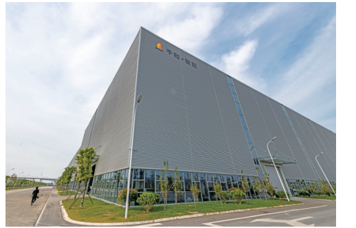
千和装配基地

不动产登记中心作为全省唯一入选自然资源部《不动产登记规程》参编单位。全力推进一体化平台建设,存量房转移登记、存量房转移抵押组合登记、商品房转移预告登记、抵押预告登记、新建商品房转移登记、抵押预告转本登记等业务,已基本实现全流程线上办理。全市所有地区均已按期实现了不动产抵押登记、商品房预售、抵押预告登记和不动产登记信息查询“跨省通办”。