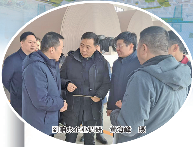
到响水企业调研