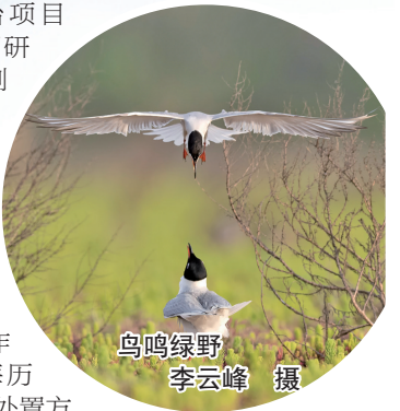
鸟鸣绿野

工作。东台项目建议书及可行性研究报告已编制完成,并通过专家评审。有序推进围填海历史遗留问题处置,响水港区小蚌牛作业区围填海历史遗留问题处置方案获自然资源部备案批准。 深化绿色生态建设。 深入开展国际湿地城市创建工作,加大宣传力度,将《湿地保护法》列为市政府常务会议学法内容,利用湿地日、湿地保护法实施日宣传湿地保护法和湿地相关知识,通过与电视台合作,利用市区的LED大屏、平面灯箱、移动数字电视,全方位、高密度、立体式宣传创建工作成果。目前我市已建成国际湿地城市。 加大造林绿化力度。 全市累计完成投资3.57亿元,完成新造林14133亩,其中,海堤和海边造林3195亩;森林抚育7.7万亩;新建和更新完善农田林网28.8万亩,启动建设绿美村庄83个。