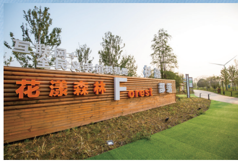
“互联网+”全民义务植树基地