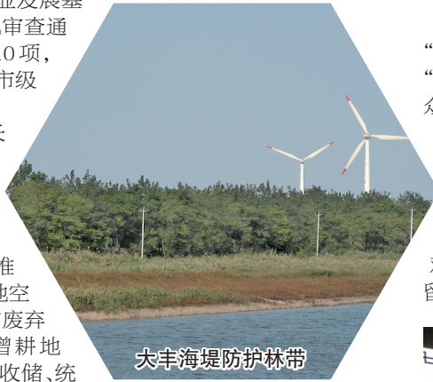
大丰海堤防护林带

强化要素护航。将服务长三角一体化产业发展基地建设作为头等大事,专班推进、定期研判,涉及要素保障的66个项目,目前已保障项目56个,剩余10个正在全力推进中。大力挖掘农村建设用地空间,规范实施增减挂钩和工矿废弃地复垦项目,今年计划新增耕地2400亩。由政府平台统一收储、统一调剂,有效保障全区重点项目用地需求。