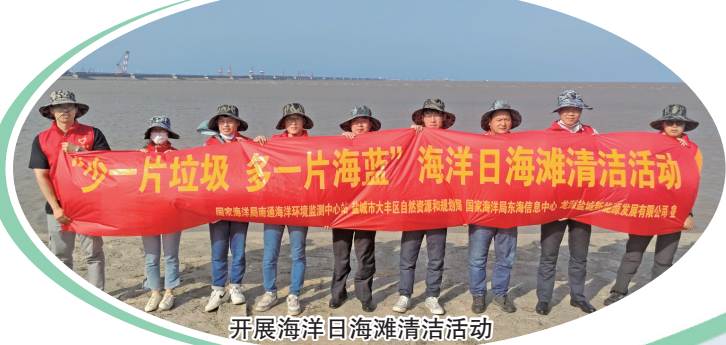
开展海洋旧海滩清洁活动

优化营商环境。落实政务服务事项“应进尽进”,将涉及自然资源和规划局的123项政务服务全部纳入窗口受理,实现“一扇门,办多件事”,确保企业和群众少跑腿。对所有服务事项强行人轨线上审批,明晰办理清单、流程、时限,真正做到不见面审批、廉洁服务。围绕沿海地区特色经济发展模式,创新打造“交海即发证”便民服务新模式,得到省自然资源厅领导的高度认可。全市率先实现“公证+不动产登记”一站式线上联办,实现了从“多点受理”到“一窗受理”,到“一人受理、线上联办”的三级跳。