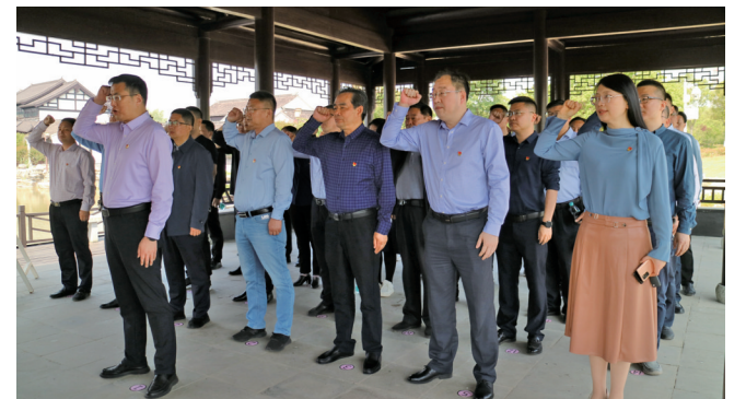
参观大丰区政德教育基地

坚持党建引领。坚持党建业务深度融合,系统上下形成“三务融合争先锋”“五心服务”等一批“党建+服务”品牌,组建“先锋自然·廉政突击队”助力全区农房发证工作,获得广大群众一致好评;开展结对共建,实现了优势互补、工作互动、资源共享,省自然资源厅海洋规划与经济处党支部作为该局结对共建支部专门发来感谢信。组织义务植树活动,赴东台黄海森林公园学习“黄海林工”精神,以实际行动深入践行“比学昔日林工精神 勇当今朝服务排头”承诺,推动大丰林业高质量发展。开展“510”主题活动,组织系统分批次参观大丰区政德教育基地,以“梅”为媒,在全系统大力营造“只留清气满乾坤”的清廉氛围。