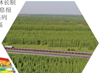
大丰林场万亩林海

严管林业发展。突出沿海绿化、河道绿化等重点区域,超额完成年度造林绿化任务,新造成片林4384亩,完成率146.1%。深入推行林长制,全区设立区级林长28人、镇级林长167人、村级林长214人,制定出台林长制会议、巡林、督查、信息报送及工作考核等一系列制度,推动全区林业高质量发展。