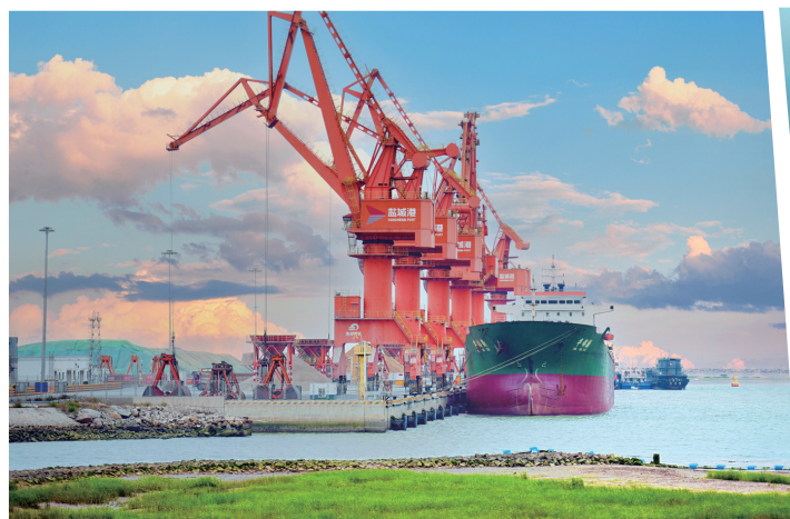
滨海港将形成亿吨吞吐能力