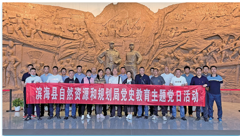
滨海县自然资源和规划局党史教育主题党日活动

今年以来,滨海县牢固树立节约集约理念,把节约集约用地、提高土地利用效率作为推进发展转型的重要抓手,不断促进全县经济发展方式转变和结构调整,助力“向海图强”发展战略。2021年,滨海县荣获“江苏省自然资源节约集约利用进步奖”。